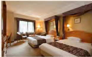
プレミアーム/スタンダード