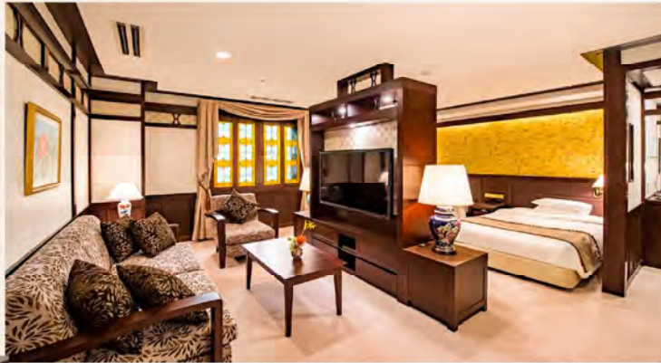
浪漫ラグジュアリー

「優雅さとゆとり、上質なくつろぎ」 「浪漫ルーム」は人正時代にタイムスリップしたような非日常の空間に誘うこだわりのインテリアデザイン。アメニティにも金沢の魅力を伝える伝統工芸や上質さを追求しました。金沢観光の拠点にふさわしい優雅な空間で心ゆくまでお寛ぎください。