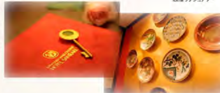
【客室数】全85室／洋室76室和室9室

また、客室には九谷焼のコーヒーカップや金沢漆器の小箱など、伝統美を活かしたしつらえも施しており、ラグジュアリーで心なごむひとときがお過ごしいただけます。