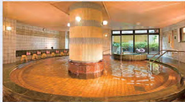
<泉質>ナトリウム塩化物、炭酸水素塩類 <効能>神経痛、筋肉痛、慢性皮膚病、冷え性、薬部効果、歯茎消毒